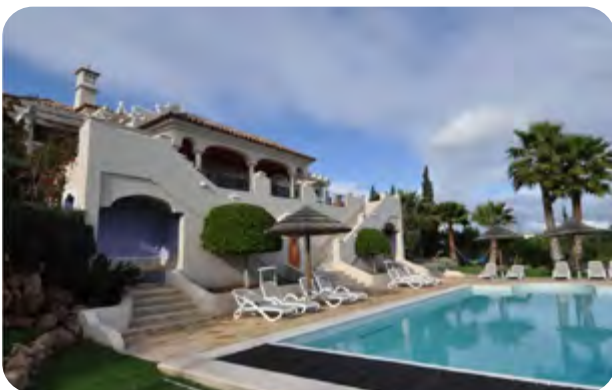
✗ Ohne Sonne

Fotografieren Sie daher immer mit geöffneten Vorhängen und eingeschaltetem Licht.