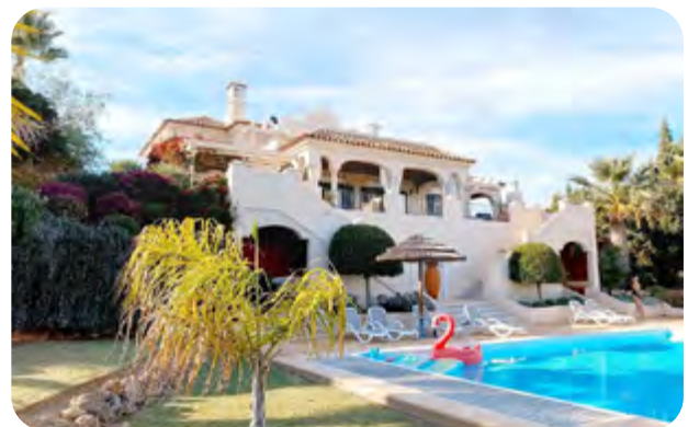
✓ Mit Sonne